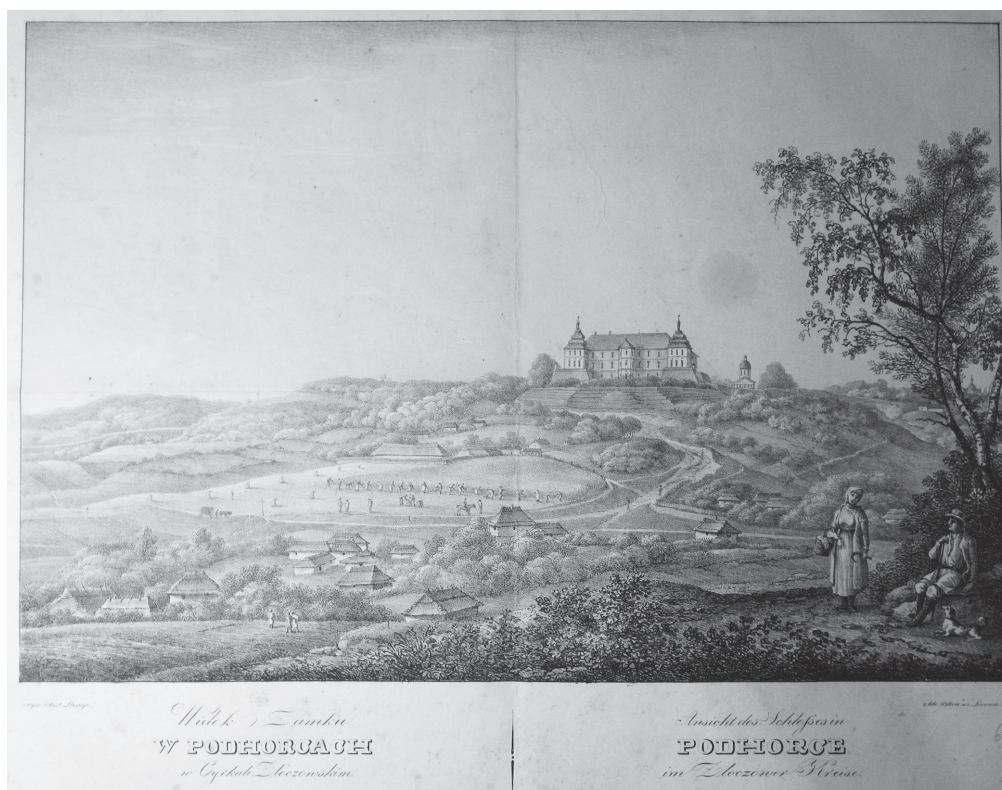
Додаток 4. A. Lange. W Podhorcach w Cyrkule Złoczowskiem (z litog. Pillera we Lwowie), II poł. XIX w. (ANK-3, s. 303)