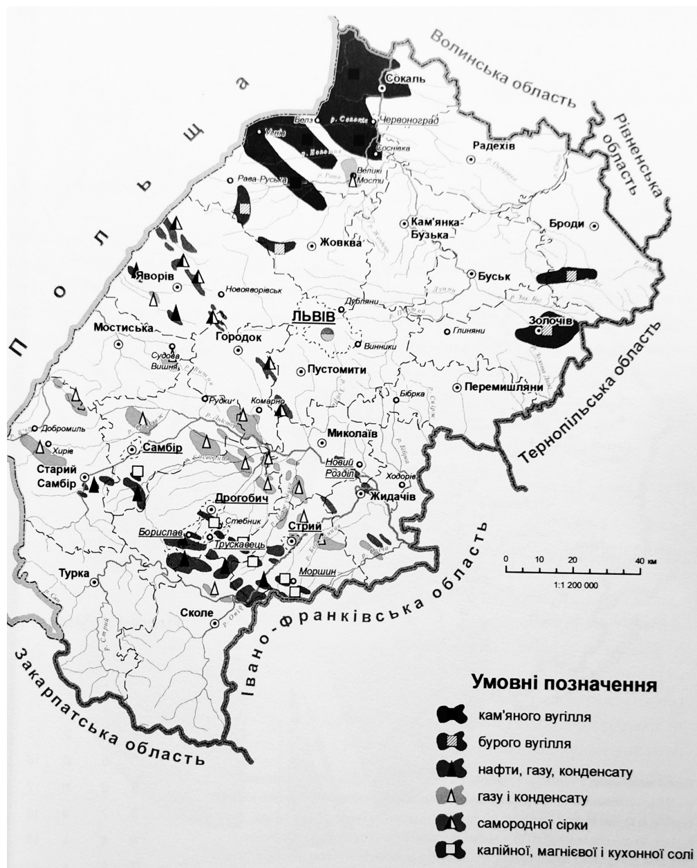
Додаток 7. Основні родовища корисних копалин Львівської області (басейнова та гніздова форми територіального поширення) (Назарук, 2018, с. 87)